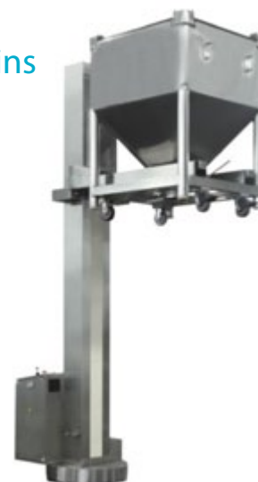
Bin no incluido

200, 300, 400, 600, 800, 1000, 1200, 1500, 1800, 2000, 2500 y 3000 Kg.