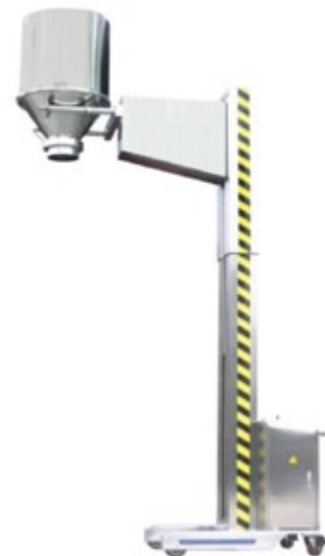
Olla no incluida

Modelos disponibles (Kg. de capacidad de carga): 50 y 100 Kg.