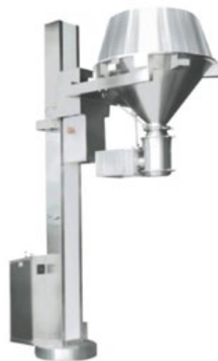
Bowl no incluido

Molino (Rangos de producción en Kg / h.): 10-100, 20-200, 45-450, 70-700,100-1000