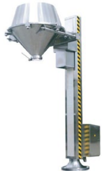
Bowl no incluido

Diferentes modelos para diferentes capacidades de carga: 50 Kg, 100 Kg, 200 Kg, 300 Kg, 500 Kg, 800 Kg y 1000 Kg.