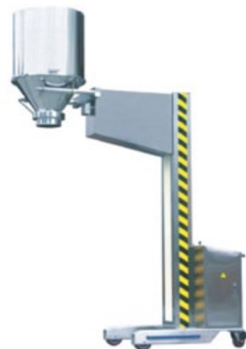
Olla no incluida

Modelos disponibles (Kg. de capacidad de carga): 50 y 100 Kg.